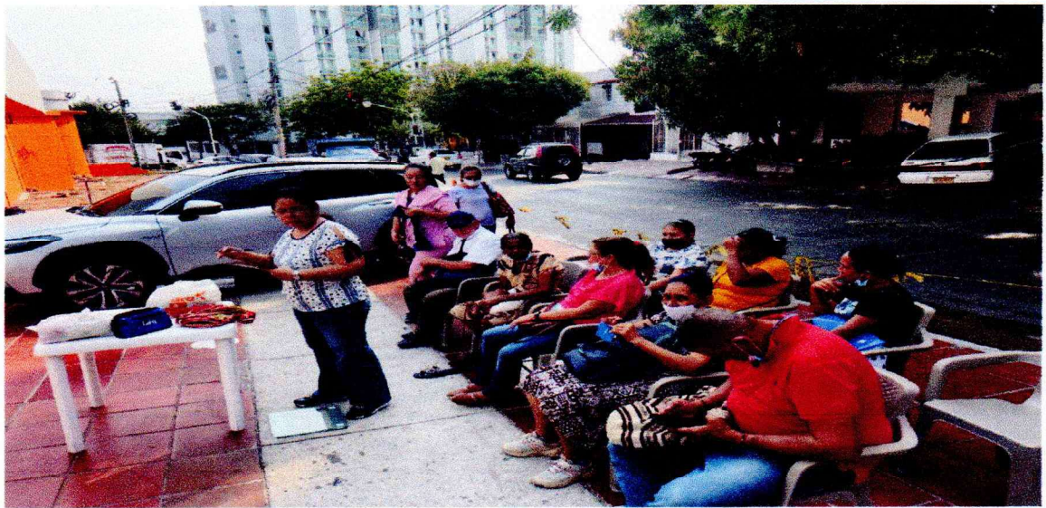
EXPOSICION SOBRE BUENOS HABITOS ALIMENTICIOS