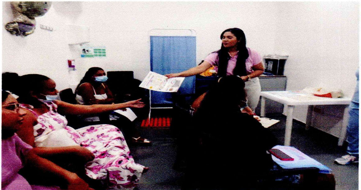
CAPACITACION A GESTANTES DE ALTO RIESGO