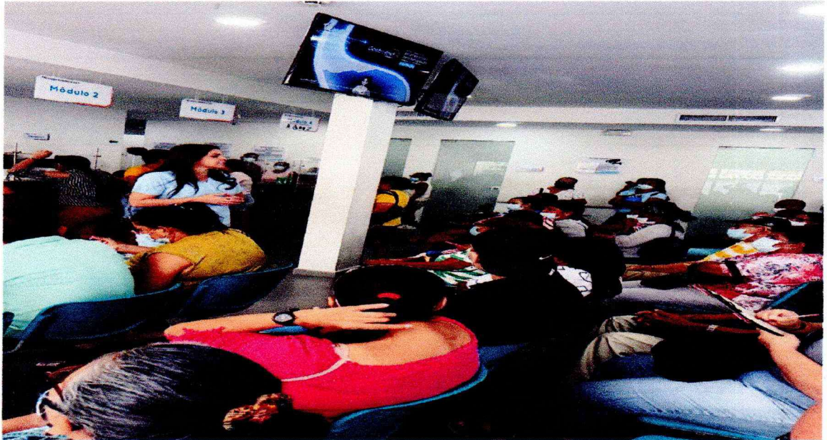
CAPACITACION EN SALA A PACIENTES DE RIESGO VASCULAR