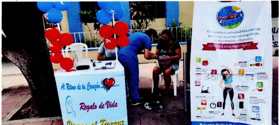
PRUEBA RAPIDA A PACIENTE DEL PROGRAMA REGALO DE VIDA